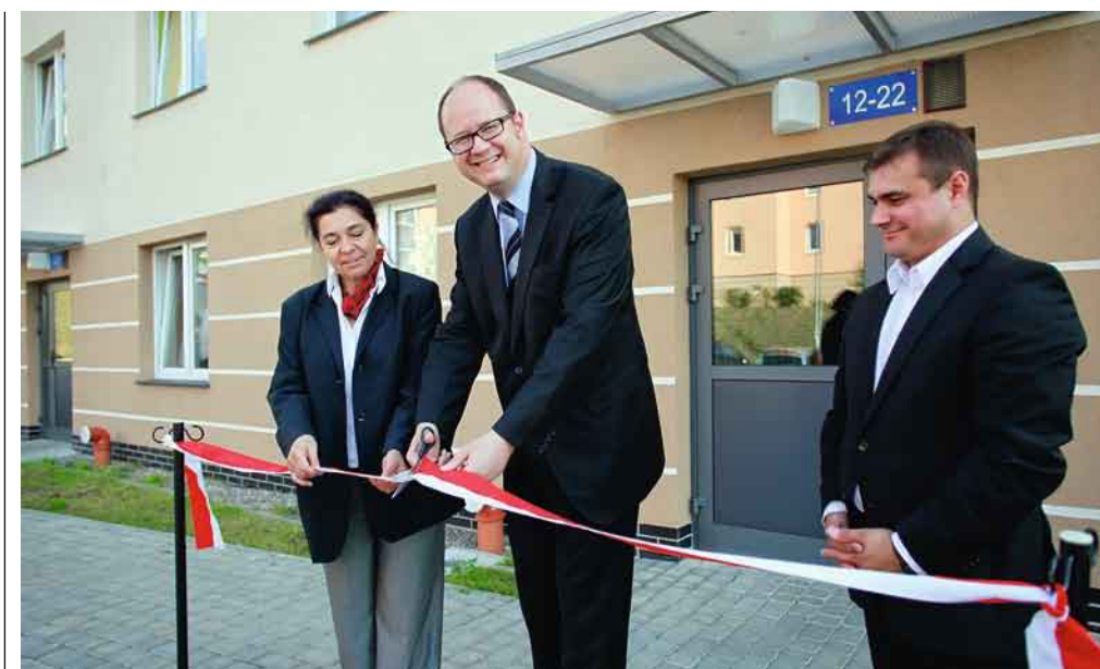
Otwarcie nowych mieszkań GTBS przy ul. Jeleniogórskiej 15 i 15a oraz ul. Wilanowskiej

Pod koniec września prezydent Gdańska Paweł Adamowicz wręczył klucze mieszkańcom nowych 125 mieszkań wybudowanych przez GTBS przy ul. Jeleniogórskiej 15 i 15a oraz ul. Wilanowskiej 2. Budynek ten wybudowano w formule partycypacji osób fizycznych w kosztach budowy w wysokości 30 proc. wartości inwestycji zgodnie z Uchwałą nr XLII/1216/09 Rady Miasta Gdańska z 26.11.2009 r. Średni metraż wybudowanych mieszkań wyniósł 49,41 m kw. W skład inwestycji GTBS, oprócz samych budynków w tzw. standardzie pod klucz, wchodzi również infrastruktura w postaci wewnątrzsiedlowych dróg kołowych, parkingów i dróg pieszych, ukształtowania i zagospodarowa-